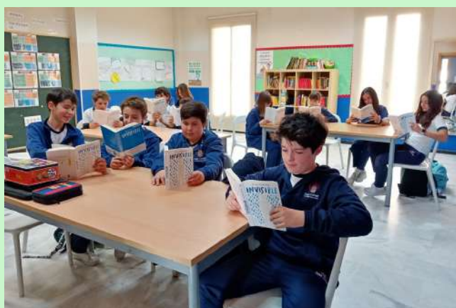
Year 7 students enjoy reading.