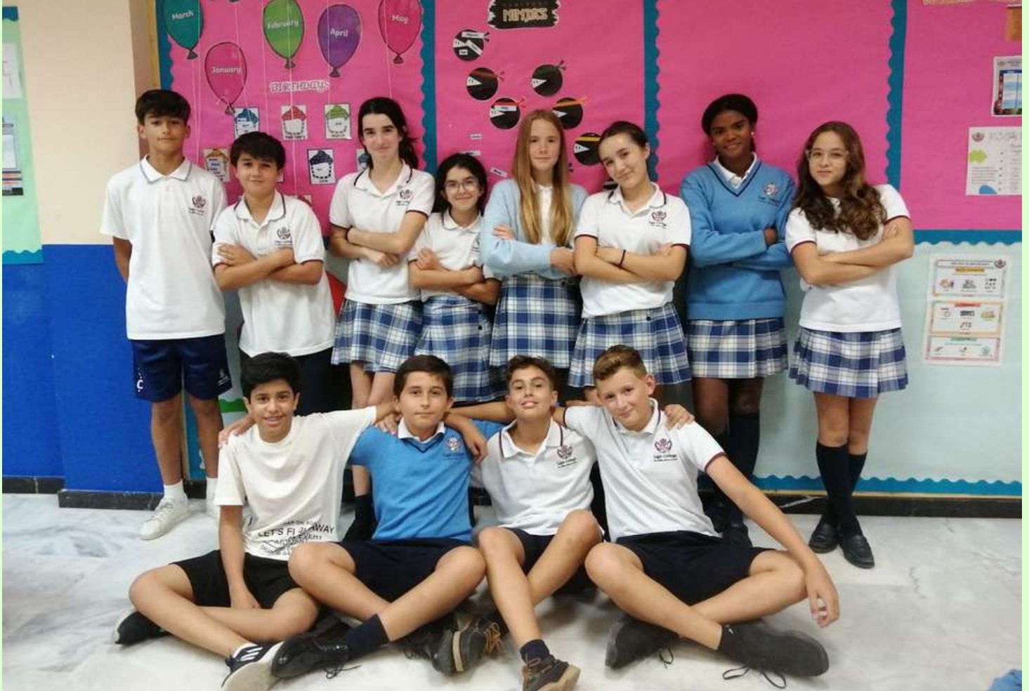
Spanish as first and second language students sharing culture, costumes, traditions and language

En Sage, se imparte la asignatura de Lengua Castellana como primera lengua y "Spanish" como segunda lengua. De hecho, cada vez mas estudiantes internacionales se acercan al español como segunda lengua y queremos celebrar el 12 de octubre como "El Día del Respeto a la Diversidad Cultural" . Estamos orgullosos de ser un colegio internacional y en esta festividad queremos reflexionar sobre la importancia que tiene para toda la humanidad la aceptación recíproca entre las culturas, el respeto por sus costumbres y tradiciones lo cual nos ayudará a incrementar la cultural de un país y queremos invitaros a lograr un entendimiento común donde la paz y la tolerancia sean los dos pilares fundamentales en nuestra sociedad. Pensamos que el hecho de estudiar una lengua extranjera nos ayuda a conocernos y entendernos mejor. ¡Bienvenidos a un mundo mejor!, ¡Bienvenidos a Sage!