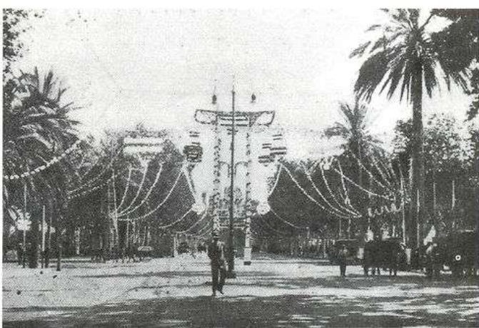
El Real de la Feria en los años 20.

Con cuatro palos y dos trozos de tela -tal cual- se montaban antaño aquellas casetas históricas que han dado paso a las actuales, perfectamente diseñadas, climatizadas en muchos casos y con todas las comodidades para el feriante de a pie.