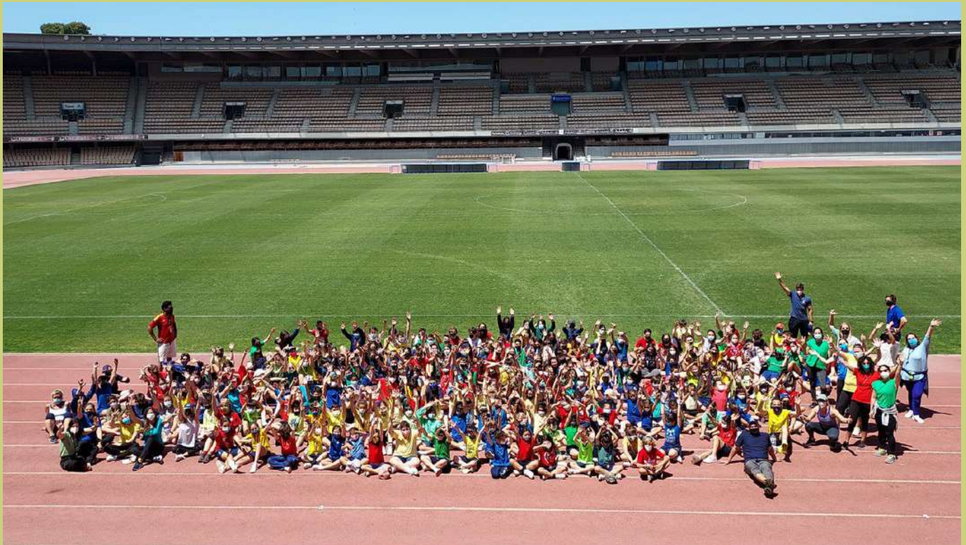
Estudiantes y personal de Sage College en el Estadio Olímpico Chapín