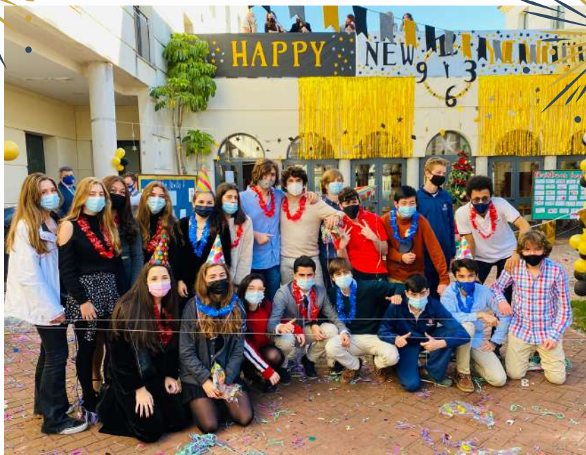
Year 11 celebrando la New Year's Eve Party en Sage College